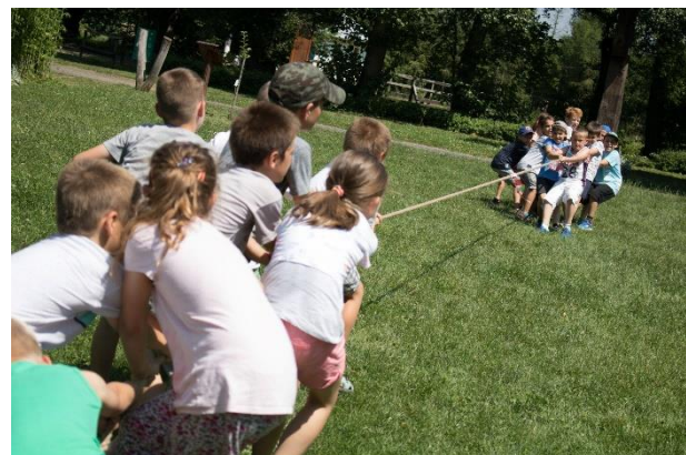
Slika 4 in 5: Odmik od strokovne naravnosti proti večji vsebinski dostopnosti dediščine za različne ciljne skupine (muzej Göcseji)

Po zbranih napotkih in smernicah je sledila diskusija v okviru katere so sodelujoči povzeli svoje ugotovitve. Kot skupen rezultat prvega dne delovnega srečanja so opredelili prenos znanja glede varovanja in dostopnosti kulturne dediščine in razvoj skupnih smernic in predlogov, ki bodo služili kot pomemben vir napotkov za druge organizacije, ki delujejo na področju varovanja, revitalizacije in promocije kulturne dediščine.