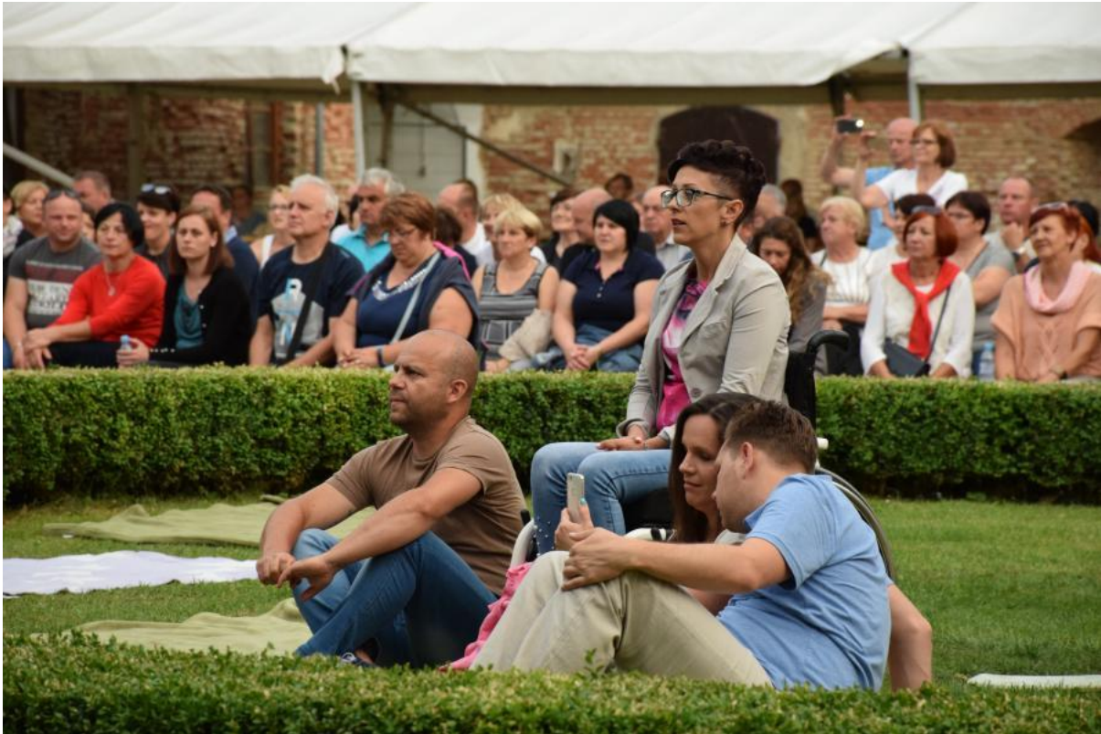
Slika 3: Izzivi zagotavljanja primerne infrastrukture za gibalno ovirane osebe v dvorcu Rakičan

Posebno pozornost so sodelujoči namenili zagotavljanju dostopnosti do kulturne dediščine socialno ranljivim skupinam. Izpostavili so naslednje smernice: