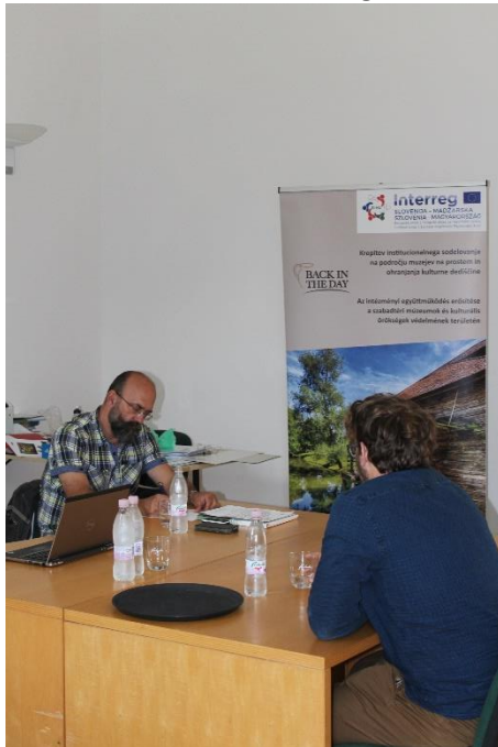
Slika 1: Strokovno usmerjanje na temo dostopnosti na primeru dvorca Rakičan

V okviru zagotavljanja dobrega sodelovanja in prenosa znanj je med 29. in 30. junijem 2018 v prostorih Raziskovalno izobraževalnega središča Dvorec Rakičan potekalo dvo-dnevno delovno srečanje na temo