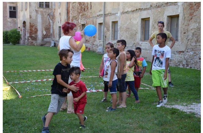
Slika 6 in 7: Izkušnje projektnega partnerja RIS Dvorec Rakičan pri doseganju predstavnikov ranljivih ciljnih skupin (primer programa ZZ ROM, namenjenega vključevanju romske skupnosti)