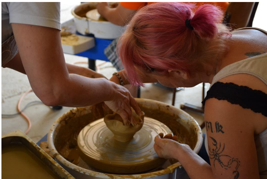
Slika 8: Vključevanje predstavnikov nacionalnega programa socialne aktivacije v lončarske delavnice partnerja RIS Dvorca Rakičan